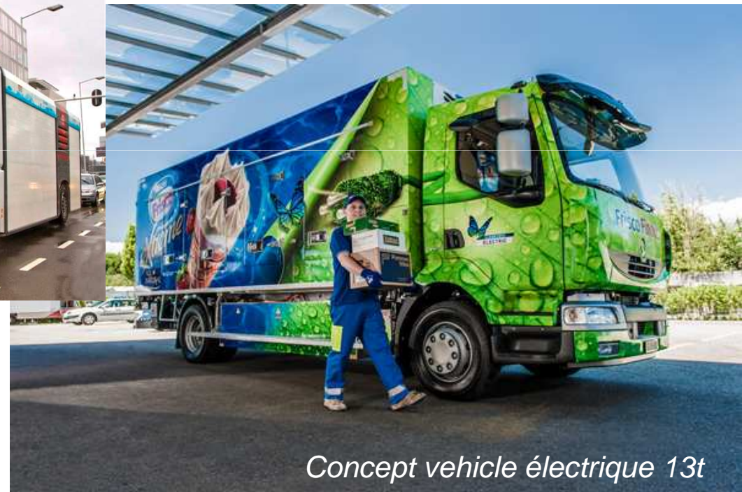
Concept vehicle électrique 13t